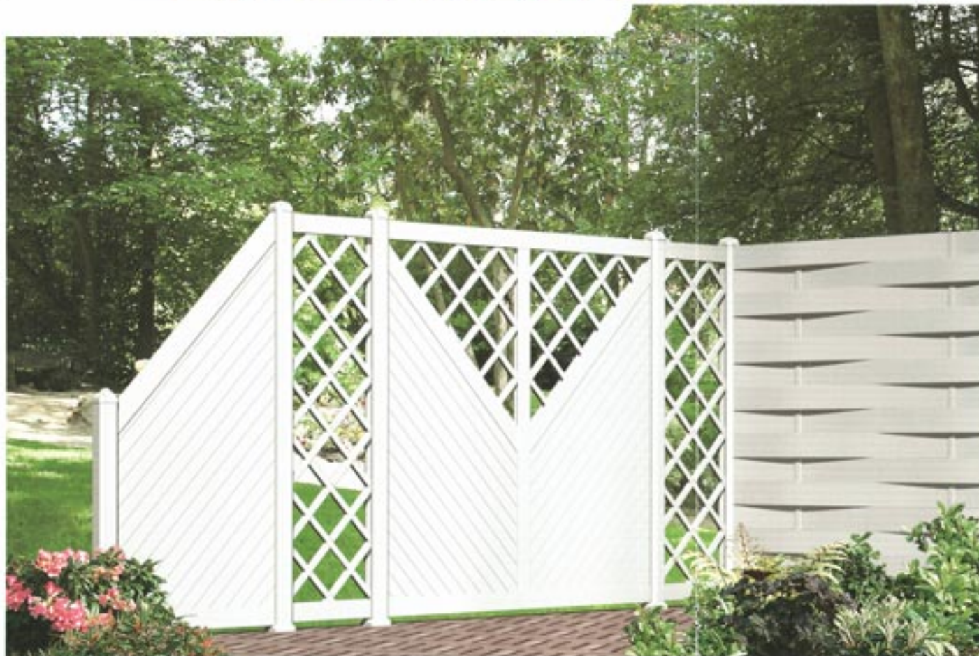
▶ Suggestion de montage