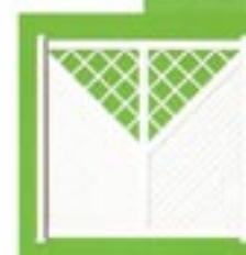
Pare-vue plein diagonal avec treillis