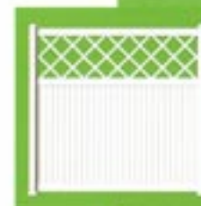
Pare-vue plein vertical avec treillis